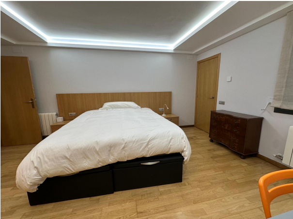
WhatsApp Image 2024-06-28 at 13.14.29 (16)