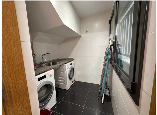
WhatsApp Image 2024-06-28 at 13.14.29